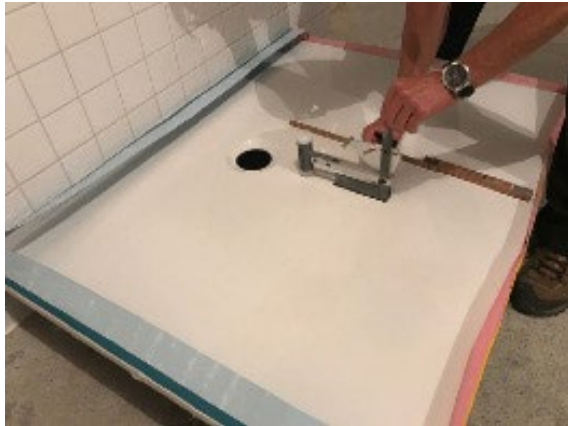
Fig. 1: Situazione di installazione nel locale emittente