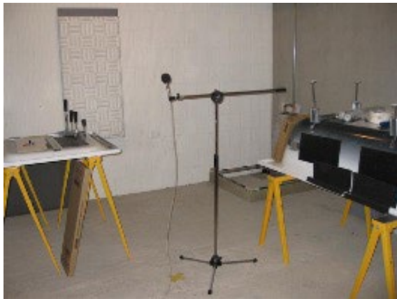
Fig. 3: Apparecchio di misurazione piano inferiore - verticale - locale di misurazione 1.2