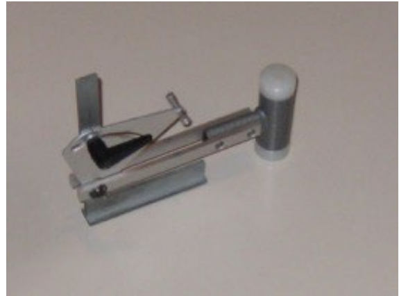
Fig. 2: Martello a pendolo EMPA