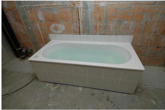
Abb. 1: Einbausituation im Anregungsraum