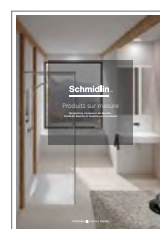
Schmidlin Produits sur mesure Baignoires, receveurs de douche, fonds de douche et lavabos personnalisés