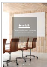
Schmidlin Tableaux blancs et noirs La solution sur mesure en acier-titane émaillé