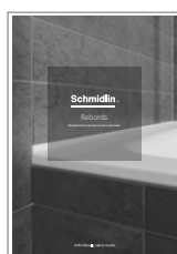
Schmidlin Rebords Durablement étanche et sans entretien