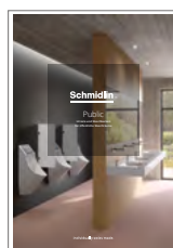
Schmidlin Public Urinoirs et lavabos pour sanitaires publics