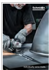
Schmidlin individually swiss made Catalogue image

(imprimés ou numériques : www.schmidlin.ch )