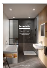
Schmidlin SWISS LINE Produits suisses de qualité pour les affaires d'objet