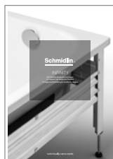
Schmidlin INFINITY Le support de baignoire flexible