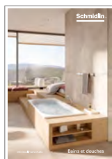
Schmidlin Bains et douches Catalogue de produits baignoires, receveurs et fonds de douche