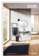
Schmidlin Lavabos Catalogue de produits lavabos