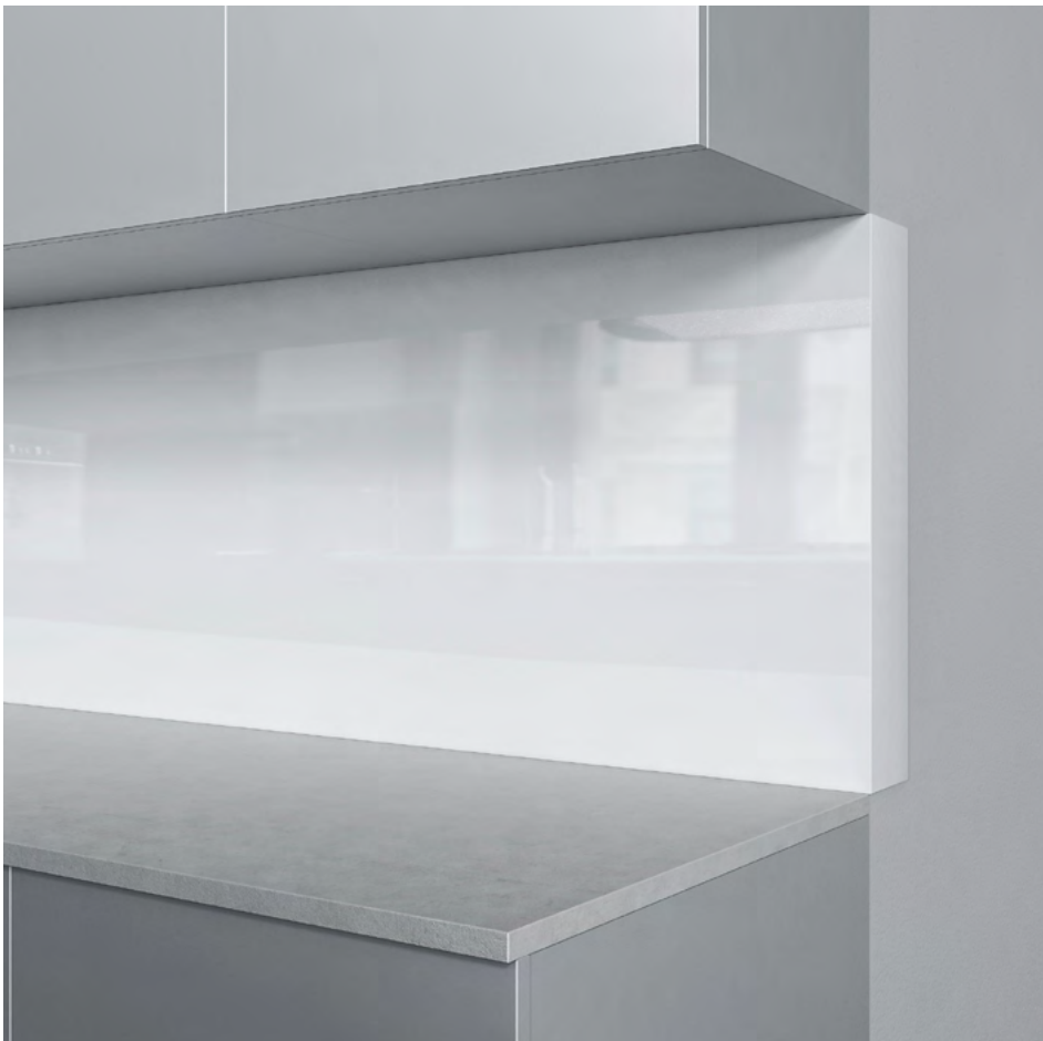
Entre-meuble de cuisine de Schmidlin, option «bord incurvé»