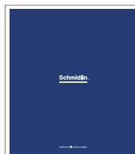
Schmidlin Couleurs Échantillons de couleurs classes de couleurs I - VI

Nous déclinons toute responsabilité en cas d'erreur d'impression ou d'informations et d'illustrations techniques erronées.