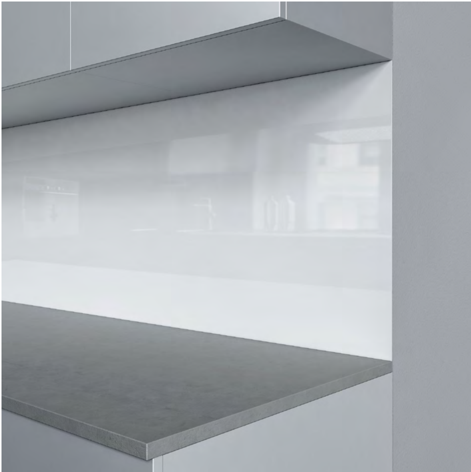
Entre-meuble de cuisine de Schmidlin, option «bord apparent»