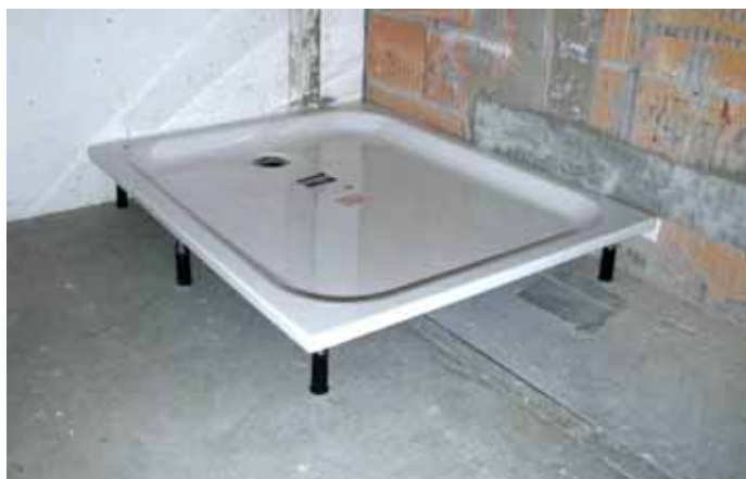
Abb. 1: Duschwanne 120x100x6.5 auf Montagerahmen mit Fusset 6 vor der Verlegung des Unterlagsboden

Die Duschwanne wurde im OG eingebaut. Die Messungen nach SIA 181 erfolgen im UG. Die Bodenstärke des Labors beträgt 22cm Beton. Der Einbau erfolgte auf den Rohboden.