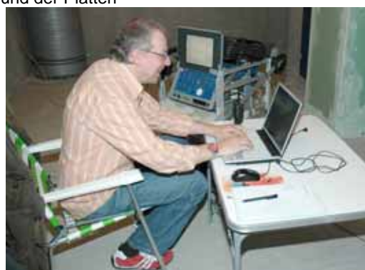
Abb. 4: EMPA Messeinrichtung