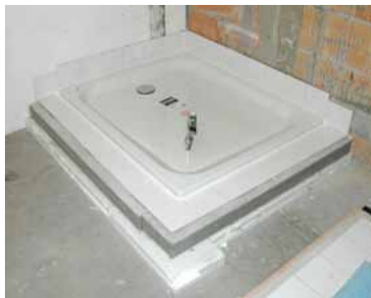
Abb. 2: Duschwanne nach der Verlegung des Unterlagsboden und der Platten