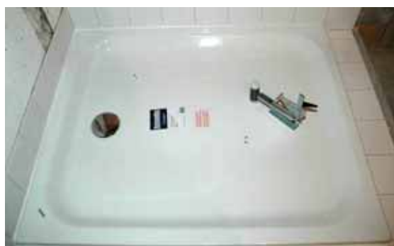
Abb. 3: Anschlagpunkte für die Benutzungsgeräusch Anregung mittels genormtem EMPA-Pendelfallhammer